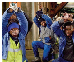
La France qui se lève tôt , H. Chesnard

Pourvu qu'on ait l'ivresse (France, 1958, 20 min.) Jean-Daniel Pollet