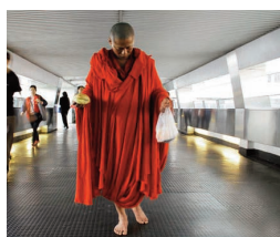
Walker - Beautiful 2012 T. Min-Liang

La France qui se lève tôt (France, 2011, 20 min.) Hugo Chesnard